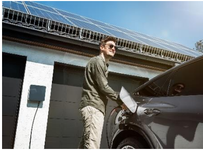
Spelsberg_AK E-Mobility im Verbund mit Wallbox_01.jpg

Das Bundle der Spelsberg Wallbox Smart Pro ermöglicht es, PV-Überschussstrom effizient zu nutzen. Dies fördert eine nachhaltige Mobilität und reduziert den Strombezug aus dem Netz.