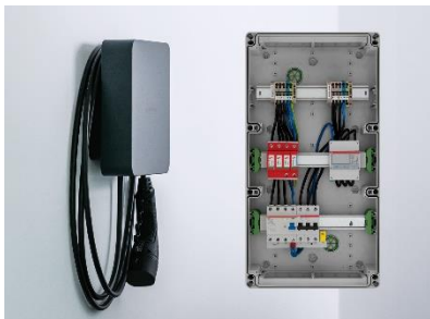
Spelsberg_AK E-Mobility im Verbund mit Wallbox_02.jpg